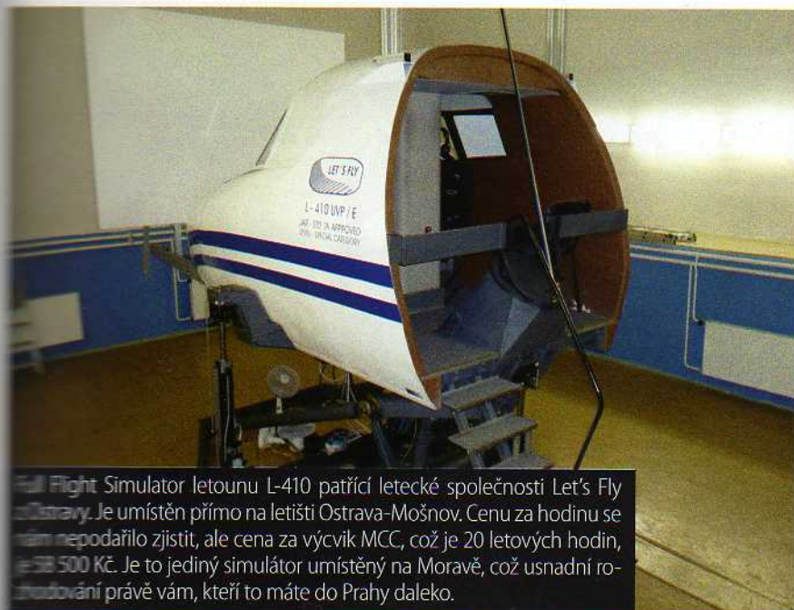
Full Flight Simulator letounu L-410 patří letecké společnosti Let's Fly z Ostravy. Je umístěn přímo na letišti Ostrava-Mošnov. Cenu za hodinu se nám nepodařilo zjistit, ale cena za výcvik MCC, což je 20 letových hodin, je 58 500 Kč. Je to jediný simulátor umístěný na Moravě, což usnadní rozhodování právě vám, kteří to máte do Prahy daleko.

... kombinují, piloti jsou tedy cvičeni na simulatoru, u nichž je pravděpodobnost, že k nim dojde, poměrně mizivá. Nutno dodat, že tyto simulátory jsou v provozu téměř 24 hodin denně, kromě nutných pauz na údržbu. V současné době je až nedostatek těchto typů simulátorů.